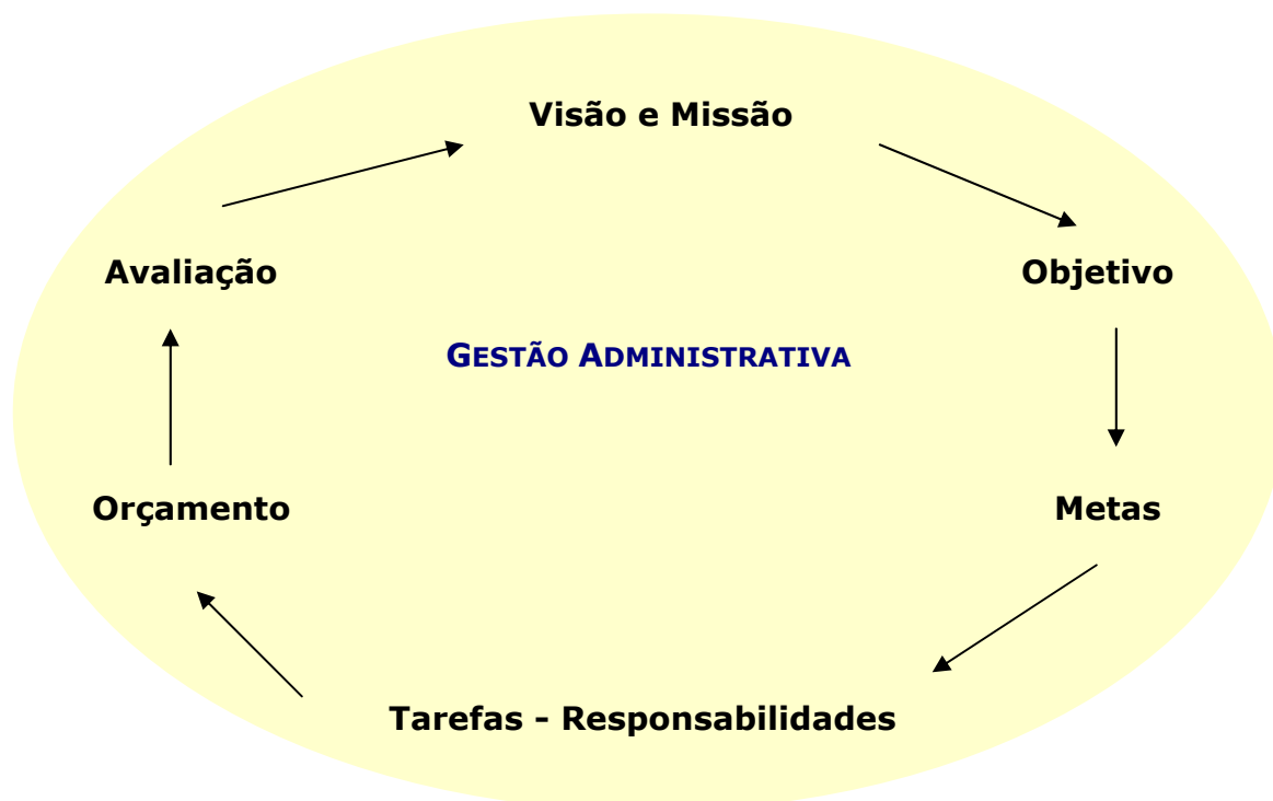
Figura 3. Diagrama do processo de planejamento

A figura também procura ilustrar que a gestão administrativa é a base da instituição. Tão importante quanto o cumprimento das metas sociais está uma gestão administrativa compatível com os valores e a missão institucional, e que, ao mesmo tempo, dê sustentabilidade e tranquilidade ao corpo técnico. A relevância da missão, a competência técnica da equipe e o cumprimento das metas, juntamente com a transparência administrativa e financeira são fatores essenciais para a conquista da credibilidade institucional.